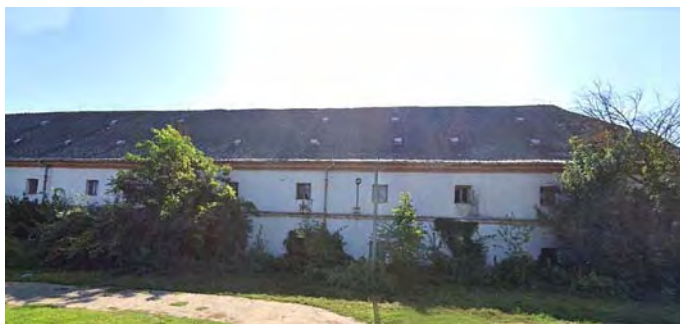
A volt dohánybevéltó

Választásunk az egykori dohánybevéltóra esett, mint ipartörténeti emlék, erről készítették a gyerekek egy rövid fényképes leírást.