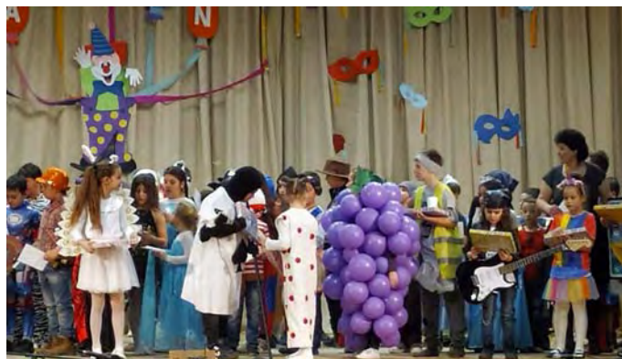
Jelmezesek a színpadon

Ezt követően jelmezesek felvonulása, értékelése zajlott.